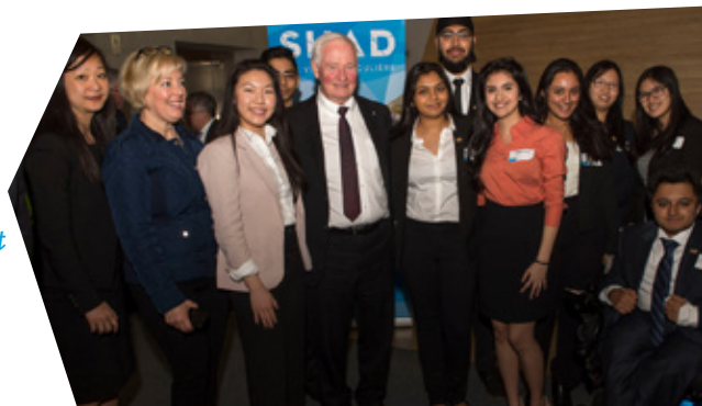
Enseignants et élèves de l'école secondaire Glenforest aux côtés du gouverneur général, son Excellence le très honorable David Johnston, à l'occasion du lancement de SHAD Ryerson

« SHAD consiste en un excellent programme d'enrichissement d'été, qui offre aux élèves hautement performants des occasions d'acquérir des compétences du XXI e siècle. De nombreux Fellows SHAD ont mis à profit ces compétences afin de se faire accepter dans des programmes postsecondaires grandement convoités et également pour décrocher de prestigieuses bourses d'études postsecondaires. Les élèves prennent part à des projets d'entrepreneuriat et à des projets en STIM du monde réel tout en tissant des amitiés durables. Le Réseau des Fellows SHAD est très vaste. Les élèves reviennent de SHAD à la fois épanouis et remplis de confiance en soi. « Le mois passé à SHAD a été le meilleur de ma vie à ce jour » est le commentaire qui revient le plus souvent de la bouche même des élèves qui ont participé à SHAD. C'est de loin le meilleur programme d'été destiné aux élèves du secondaire! »